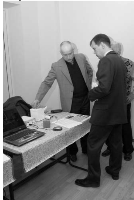
Выставка и медиа-стенд конференции