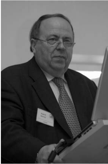
Вступительное слово от ISfTeH и лекция F.Lievens (Бельгия)

Научная программа конференции (лекции, доклады, презентации)