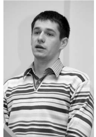
Презентации украинских компаний, производителей оборудования и программного обеспечения для телемедицины и электронного здравоохранения