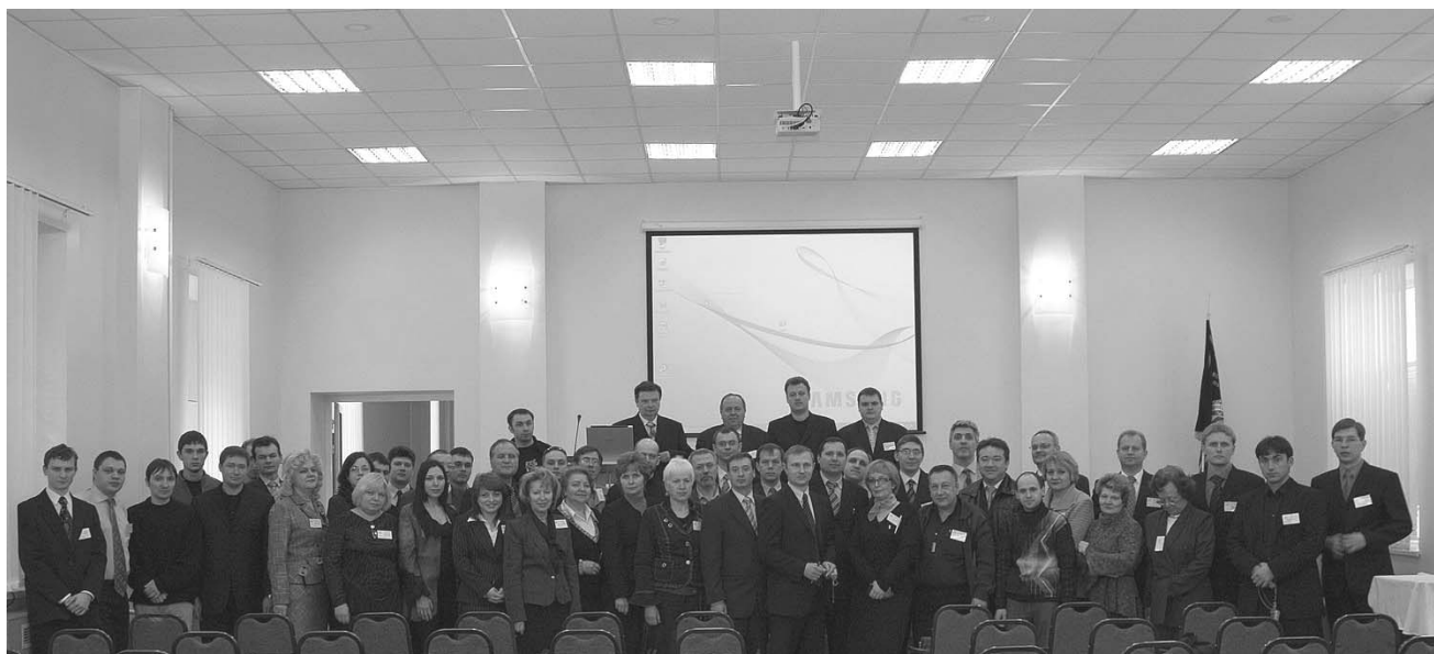
Участники конференции «Телемедицина – Опыт@Перспективы» 2007 года